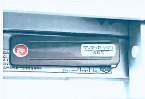
サッシの上唇等に貼付