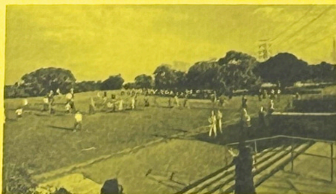
2023年第3回早起きラジオ体操の光景