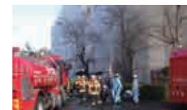
クリーンセンターの火災事故